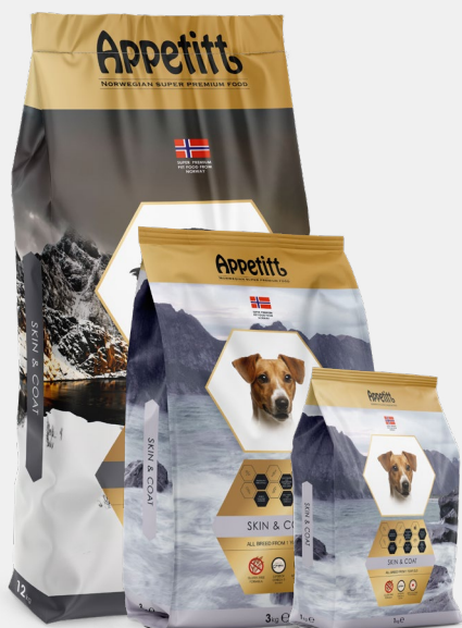
Liten / mellanstor foderkula

Helfoder för vuxna hundar från 1 års ålder